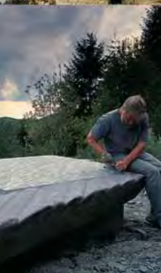
Chemin de sculptures à Bilsdorf