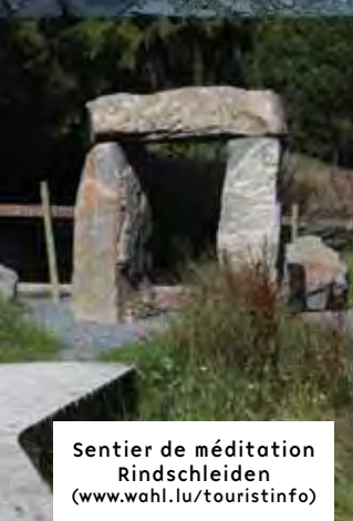
Sentier de méditation Rindschleiden ( www.wahl.lu/touristinfo )