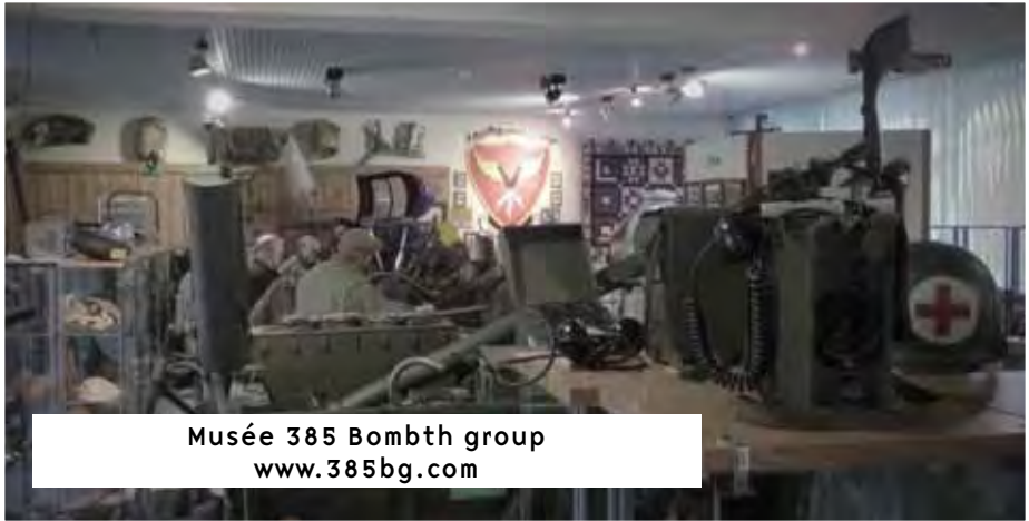
Musée 385 Bombth group www.385bg.com