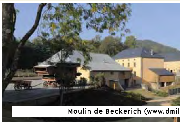
Moulin de Beckerich ( www.dmillen.lu )