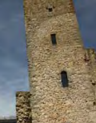
Château à Useldange avec sentier culturel